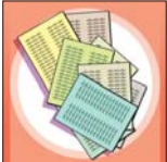
طبیب و رسانه

گذشته در کلاس‌های مؤسسه تیمورزاده شرکت کرده است، او هم درست همین را گفت و بعد ادامه داد: «بعضی از استادان واقعا استثنایی بودند ولی از آن طرف در یک سری از درس‌ها توقع ما برآورده نشد ولی در کل می‌توانم بگویم که ۸۰-۷۰ درصد از استادان خوب بودند اما مشکل عمده، برخورد بعضی از افسراد کادر اجرایی بود. گاهی اوقات بعضی از آقایان احترام افسراد حاضر در کلاس را نگه نمی‌داشتند. از نظر وقت هم به دلیل زمان برگزاری کلاس گروه پزشکی، استادان اغلب خسته بودند و البته این چاره‌ای هم ندارد». در آخر صحبت‌ها، دکتر ولی‌زاده به این اشاره کرد