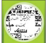
طبیب و رسانه

قیمت هیچ دارویی در ۶ ماه اول سال تغییر نمی‌کند فارس: معاون غذا و داروی وزارت بهداشت گفت: با توجه به تجربه موفق ثابت ماندن قیمت دارو در سال ۸۵، امسال نیز فهرست داروهای رسمی ایران به انضمام قیمت داروها، برای ۶ماه اول سال منتشر شده است و سازمان‌های بیمه‌گر، شرکت‌های دارویی و داروخانه‌ها خیالشان راحت باشد که به طور قطع قیمت این داروها در ۶ ماه اول سال هیچ تغییری نمی‌کند.