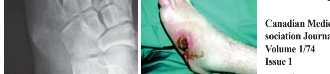
دکتر مسعود اصغرئی

زخم پا و استئومیلیت تصویر این شماره متعلق به یک مرد ۳۱ ساله است که به طور ناگهانی در قسمت خارجی پای چپ دچار درد، تورم و پورپورا شده بود. بیمار در طول ۱۰ هفته قبل مجبور به استراحت در بستر بود. بیمار با تشخیص نفرس تحت درمان با NSAIDs قرار گرفت ولی درد بیمار بهبود پیدا نکرد. یک ماه بعد در محل تورم یک پوسچول ایجاد شد و به دنبال آن یک زخم چرکی به وجود آمد. در بررسی به عمل آمده یک زخم ۲ سانتی متری که تا استخوان گسترش پیدا کرده بود مشخص شد اما بیمار تب نداشت. در تصویر رادیوگرافی، کلسیفیکاسیون تخریبی در بافت نرم با استئوپنی و واکنش پریوست استخوان متاتارسال پنجم که مطرح کننده استئومیلیت است، تشخیص را قطعی کرد. گرافی قفسه سینه بیمار نرمال بود و بیمار تحت درمان قرار گرفت.