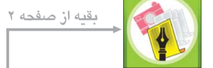
بقیه از صفحه ۲

از سال گذشته تاکنون سالانه حدود ۱۴ هزار نفر نیروی جدید در وزارت بهداشت شاغل شده‌اند ضمن اینکه با پرداخت وام‌های کارآفرینی در سال گذشته، حدود ۲۹ هزار نفر در حیطه خدمات بهداشتی - درمانی و توسعه این خدمات در کشور شاغل شدند. وزیر بهداشت در اجلاس کارآفرینی در حوزه سلامت با بیان مطلب فوق گفت: «در طی ۲ سال گذشته، ۱۳ رشته جدید مورد نیاز کشور مانند رشته نانو تکنولوژی در پزشکی و اخلاق پزشکی ایجاد شده است و رشته کارآفرینی سلامت در دانشگاه علوم پزشکی شهید بهشتی ایجاد خواهد شد». وی افزود: «تلاش ما این است که واحد مدیریت را در همه رشته‌های علوم پزشکی به خصوص رشته‌هایی مانند پزشکی، داروسازی و دندان پزشکی بگنجانیم تا فارغ‌التحصیلان این رشته‌ها توان مدیریت یک مجموعه را داشته باشند». وزیر کار و امور