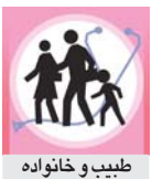
طبیب و خانواده